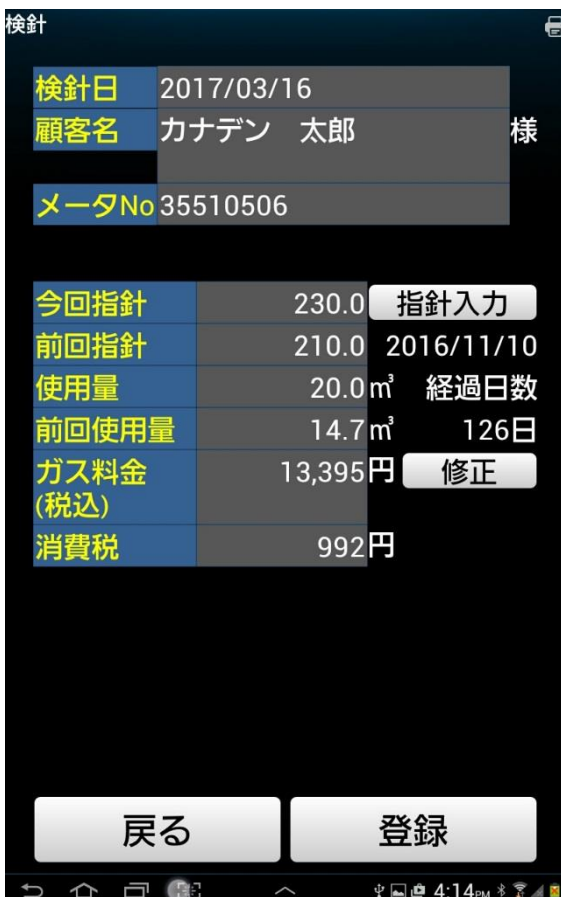
③ 自動的に得意先が特定され、今回指針値が反映される