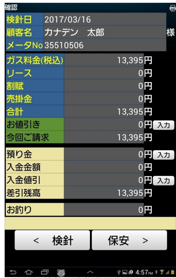
④ 検針同時集金も実施可能