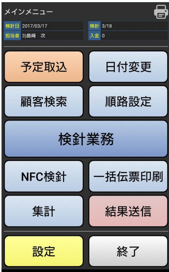
① メインメニュー画面で『NFC 検針』押下